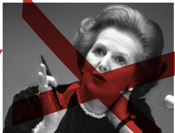
Margaret Thatcher. Forsætisráðharri í Stórabretlandi 1979-1990.