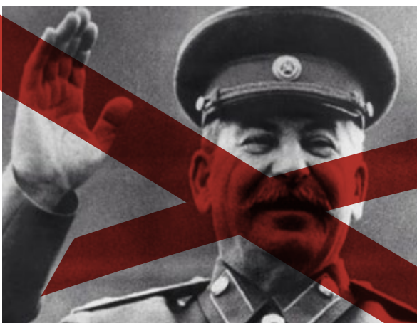
Josef Stalin. Aðalskrivari í kommunistaflokkinum í Sovjetsamveldinum 1922-1953.

Ja tað passar í ávísan mun. Vit fáa fleiri vørur, tøkni og hugskot uttanífrá, frá flogførum til Google til Nelson Mandela. Men Norðurlond geva eisini sítt íkast við grønnari orku, Bang & Olufsen, Lego, fiski, Björk, Linux, Skype og Spotify!