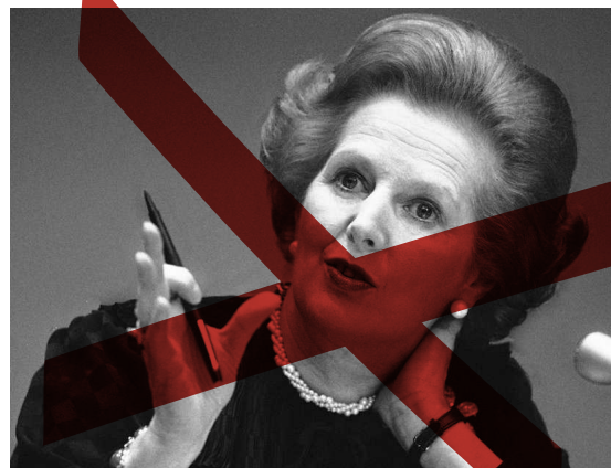
Margaret Thatcher. Ison-Britannian pääministeri 1979-1990.