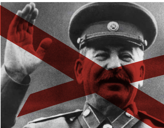
Josef Stalin. Neuvostoliiton kommunistipuolueen johtaja 1922-1953.

Näin juuri onkin. Hyödynnämme täysimääräisesti muista maista tulevia tuotteita, teknologiaa ja hyviä ideoita lentokoneista Googleen tai vaikka Nelson Mandelaan. Mutta samalla tarjoamme Pohjolasta paljon, esimerkiksi vihreä energia, Bang & Olufsen, Lego, Kone, Björk, Linux, Skype ja Spotify!