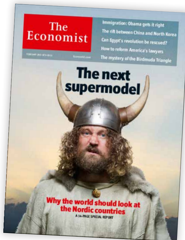
The Economist –lehden etusivu 2.2.2013.