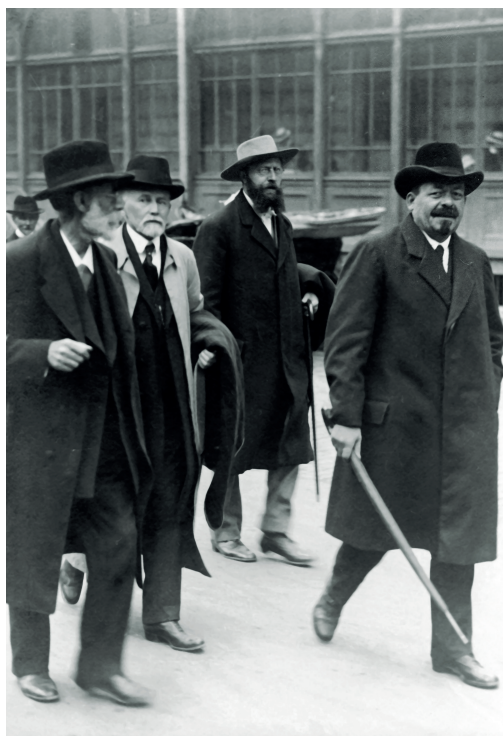
Den tyske leder af SPD, senere rigspræsident, Friedrich Ebert i spidsen foran en demonstration i Stockholm under fredskonferencerne i 1917. Yderst ses hans trofaste støtte under krigen, den danske partileder og minister Thorvald Stauning.

gift. Alle ville arbejde for fred, men midlerne mod krig kunne man ikke enes om. Dertil var arbejderbevægelsens nationale styrkeforhold for forskellige og nationale interesser afgørende. Faren for krig gav anledning til at ændre den ensidige kongresstruktur, der siden 1886 havde været omdrejningspunkt for det nordiske samarbejde. Kongressen anbefalede, at der skulle oprettes en samarbejdskomite, der hurtigere kunne sammenkaldes og tage stilling til problemer af fælles nordisk interesse. Komiteen skulle være fleksibel, hvilket indebar, at det alene var de absolutte topfolk fra parti- og landsorganisationer, der mødtes. Krigsfaren, men også frygten for splittelse inden for egne rækker havde ind-