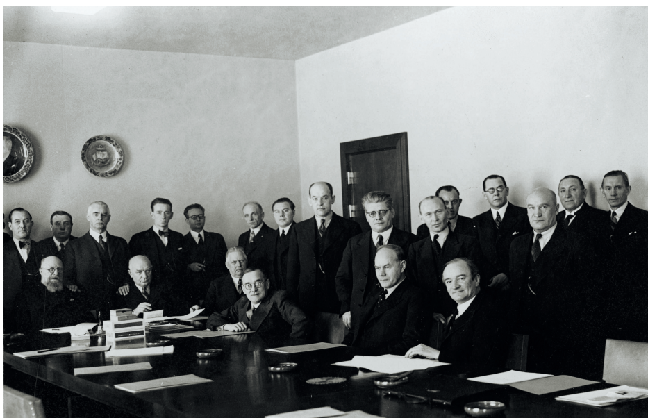
Nordisk arbejderkonference i i København i november 1936. Til stede var partiets og LOs topfolk fra Danmark, Norge, Sverige og Finland. Mødet blev omtalt som en nordisk konference, således at nordmændene kunne deltage på lige fod. I forbindelse med konferencen afholdtes det traditionelle møde i den nordiske samarbejds-komite med deltagelse af de samme folk, men nu med nordmændene som gæster.