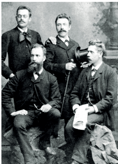
Fire danske kongresdelegerede fotograferet i Göteborg i 1886. Den første danske LO-formand(1898-1903) ses stående med sin høje hat i hånden.

Den efterfølgende kongres i København i august 1888 kastede sig over et af tidens mest brændende emner i den internationale arbejderbevægelse, nemlig forkortelse af arbejdstiden til en såkaldt normalarbejdsdag. Den nordiske fagbevægelse var derfor godt forberedt til at gå ind i den verdensomspændende kamp for 8 timers arbejde, 8 timers fritid og 8 timers hvile. Kravet blev året efter rejst på to internationale kongresser i Paris og den 1. maj 1890 lød 8 timers kravet fra demonstrationer i Norden og i hele verden fra USA til Australien.