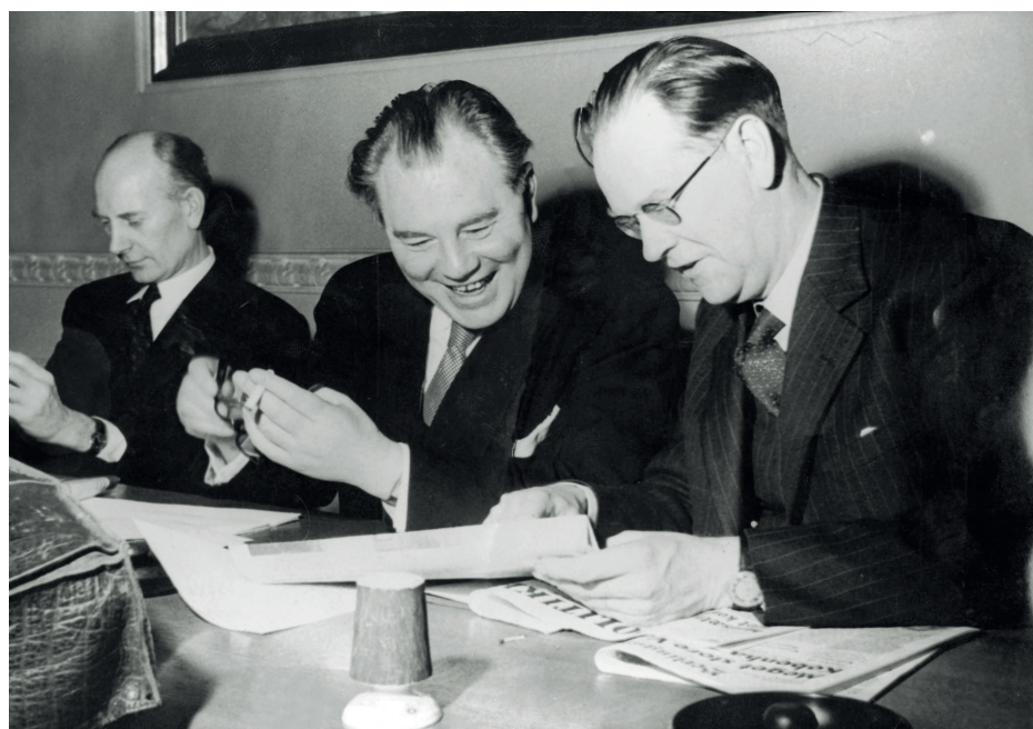
De tre hovedpersoner i forhandlingerne om en nordisk forsvarsunion i 1948. Fra venstre Einar Gerhardsen, Hans Hedtoft og Tage Erlander.

Den 8. juni 1931 indkaldte Thorvald Stauning til nordisk konference i København. Partirepræsentanter fra