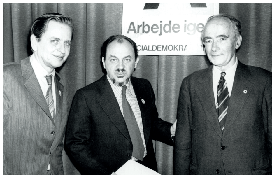
Anker Jørgensen sammen med Sveriges Olof Palme(tv) og Norges Trygve Bratteli(th)

Med denne organisationsmodel var nordisk arbejderbevægelse godt rustet til at møde den økonomiske krises udfordringer. Nu kom emner som energipolitik og industripolitik på listen over de mange problemer, man måtte tage fat på. Den primære målsætning om den fulde beskæftigelse og sikringen af befolkningens ret til et arbejde blev fastholdt og forsvaret med næb og klør. Også inden for Nordisk Råd fik kravet om arbejde til alle højeste prioritet. På det udenrigs – og sikkerhedspolitiske område lagde man et stærkt pres på det hvide styre i henholdsvis Rhodesia og Sydafrika. På arbejderkongressen i Helsingfors i 1976 blev der