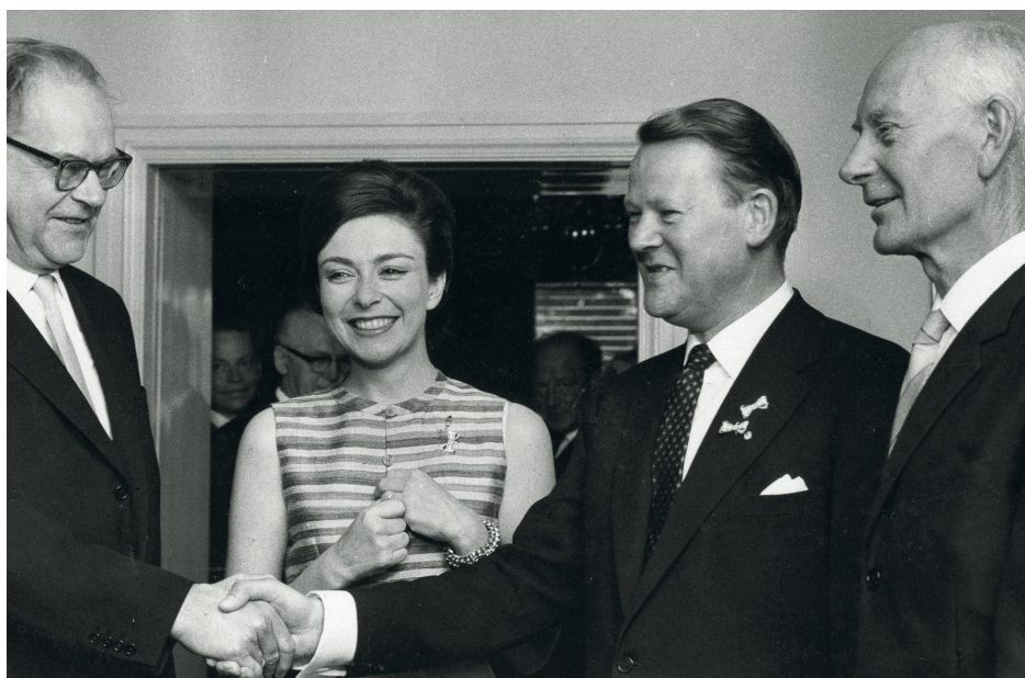
Den danske statsminister Jens Otto Krag og fru Helle Virkner flankeret af Sveriges Tage Erlander(tv) og Norges Einar Gerhard(th) i 1965.

Fra 1943 begyndte også de personlige kontakter at spille en større rolle i forbindelse med den umiddelbare overgang fra krig til fred. Her var det naturligt, at det blev det frie Sverige, som blev mødested for de nordiske politikere, der ville komme til at stå i spidsen for genopbygningen, når freden var vundet.