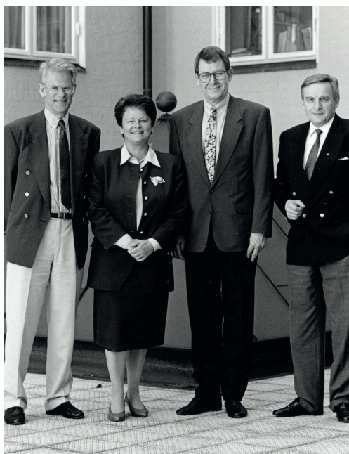
SAMAK-møde i København, 1992. Fra venstre Ingvar Carlsson, Gro Harlem Brundtland, Poul Nyrup Rasmussen og Ulf Sundqvist.

sikkerhedspolitiske situation blev fulgt tæt af den nordiske samarbejdskomite, og man valgte at nedsætte en permanent sikkerhedspolitisk arbejdsgruppe.