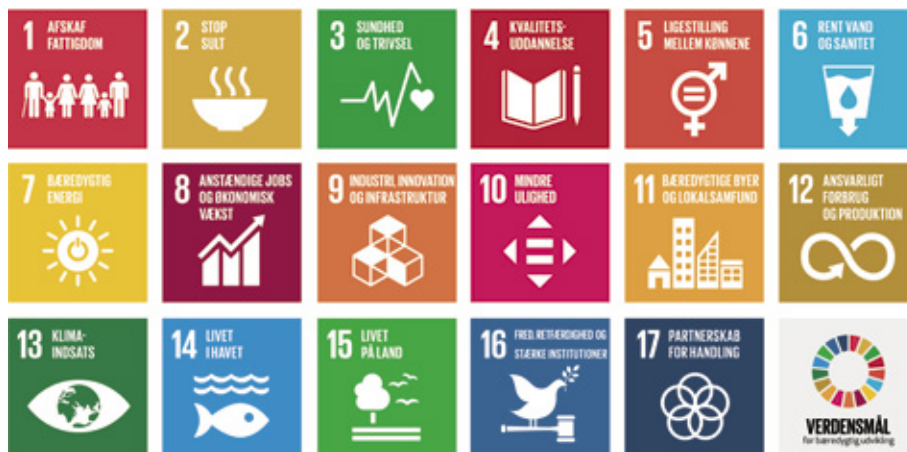
FN's 17 udviklingsmål.

Norden har en afgørende interesse i dette , både af hensyn til beskæftigelsen og til mulighederne for at skabe mere lige konkurrencevilkår mellem landene samt for at fremme menneskerettigheder, faglige rettigheder, klima og miljø.