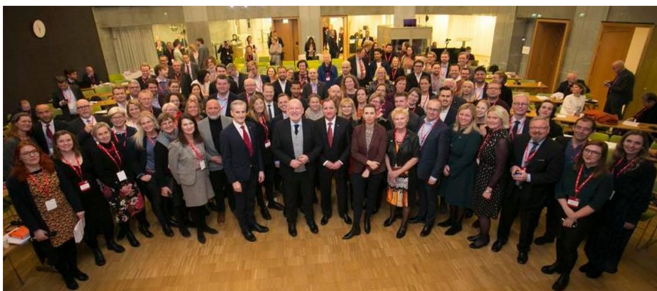
Familiebilde på SAMAKs årsmøte 2019 i Helsingfors

SDP og FFC/SAK var vertskap for SAMAKs årsmøte i Helsingfors 28. og 29. januar i tradisjonelle Paasitorni. Her deltok også visepresident i Europakommisjonen Franz Timmermans.