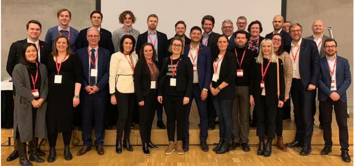
Nordenskolen årgang 4 i Helsingfors