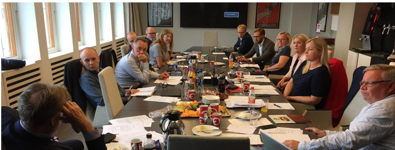
Styremøte i Oslo valgdagen 9. september: Hvordan skal SAMAK forandre seg?