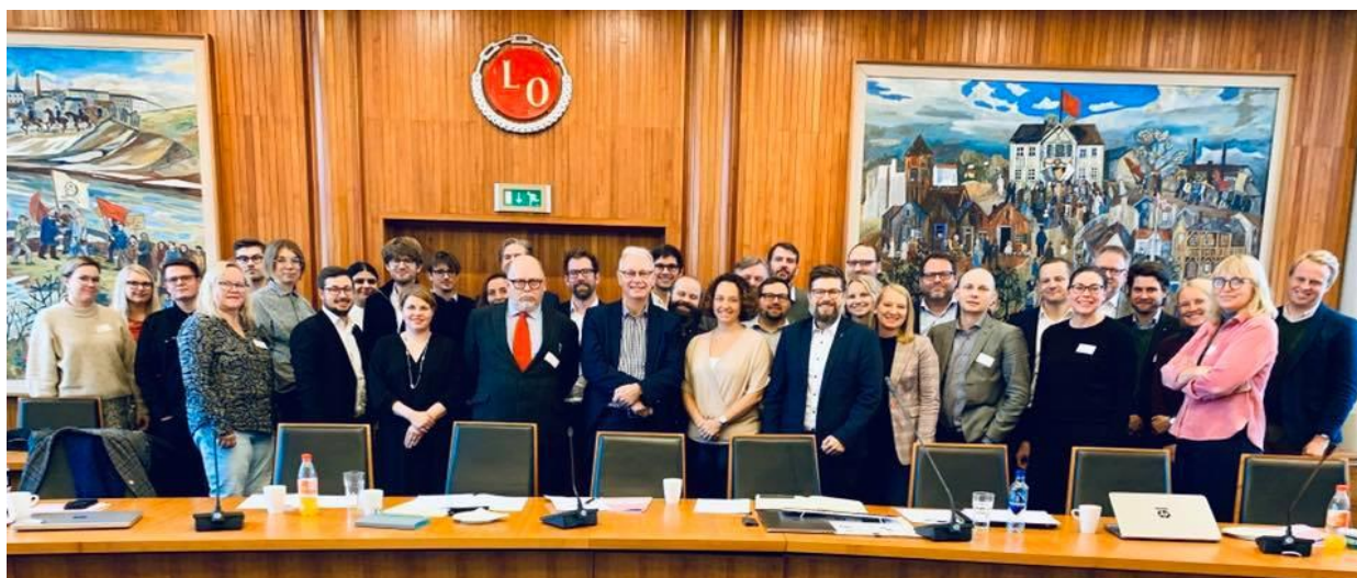
Historiens første SAMAK Kampanjeforum i Oslo 22. oktober