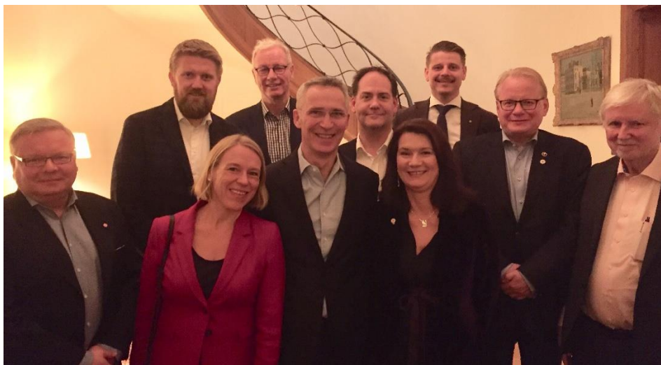
God stemning til tross for verdenssituasjonen da SAMAKs utenriks- og sikkerhetspolitiske gruppe møtte Natos generalsekretær Jens Stoltenberg