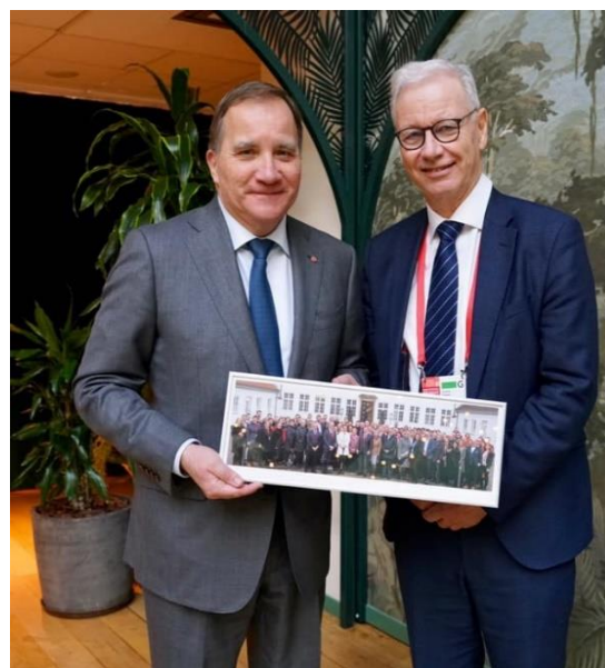
Takk til Stefan Löfven.