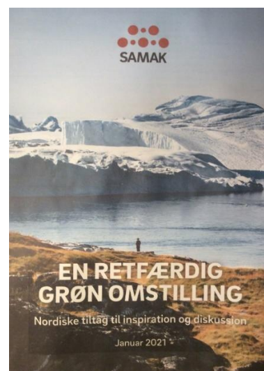
SAMAK klimarapport 2021