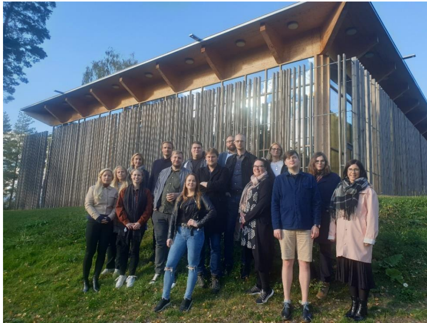
Nordenskolen årgang 6 utenfor Hegnhuset på Utøya.