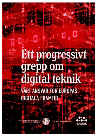
FEPS-SAMAK digitalrapport 2020