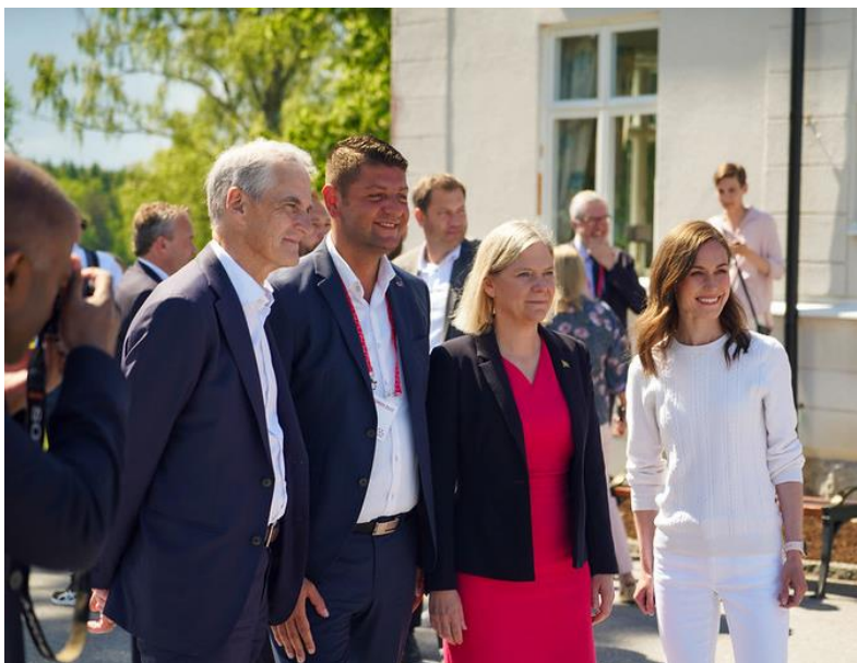
Tre statsministere og representant for Nordenskolen alumni