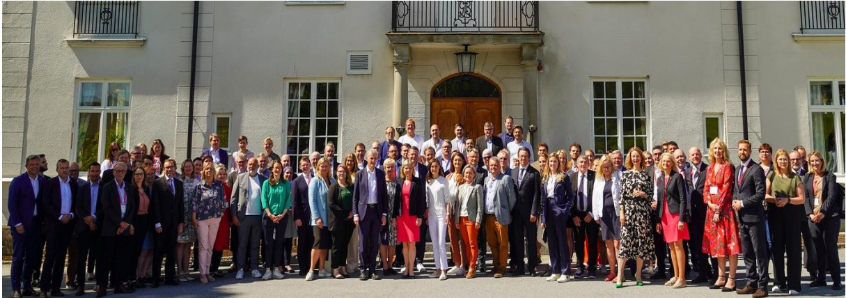
Nordenskolen Alumni sammen med delegatene på Bommersvik.